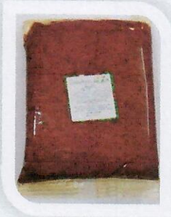
منتجات مصنع التمور عجينة تمر