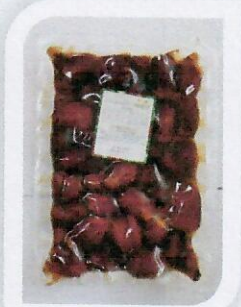
منتجات مصنع التمور تمور مكبوسة