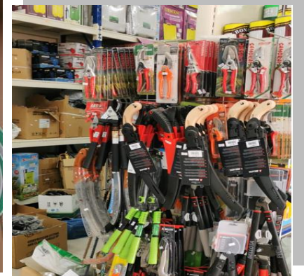
أصناف التعاونية الزراعية