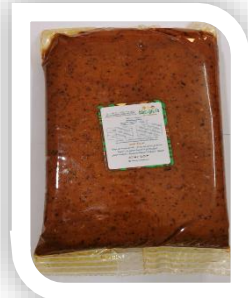
منتجات مصنع التمور عجينة تمور