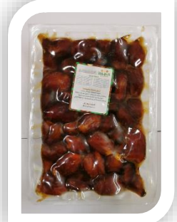
منتجات مصنع التمور تمور مكبوسة